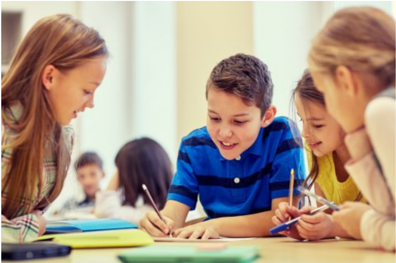
Grundschul Kinder in Gruppenarbeit